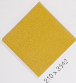
210 x 3542