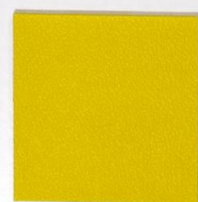
210 x 3543