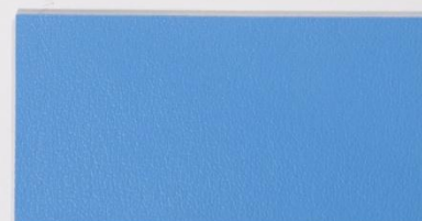
210 x 3549