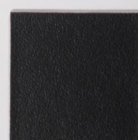
210 x 3554