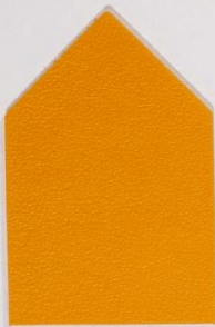
210 x 3545