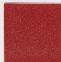
210 x 3546