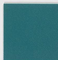
210 x 3551