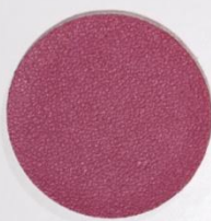
210 x 3547