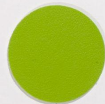
210 x 3552