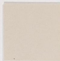
210 x 3541