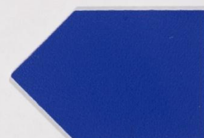
210 x 3550