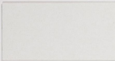
210 x 3540

UV resistant/perspiration resistant/urine resistant/salt water resistant/saliva resistant/waterproofed/tear resistant/non irritating/long durability/free of Cd/AZO/FCKW/PCP/PCB/PCT/formaldehyde and health hazard substances as prescribed by law.