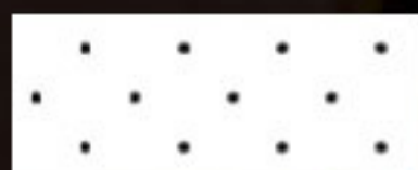
MK 9 (Porsche)