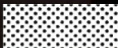
MK 10 (Klima)