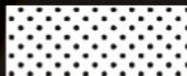
MK 3 (A2D)