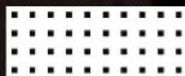
C 5 (AMG)